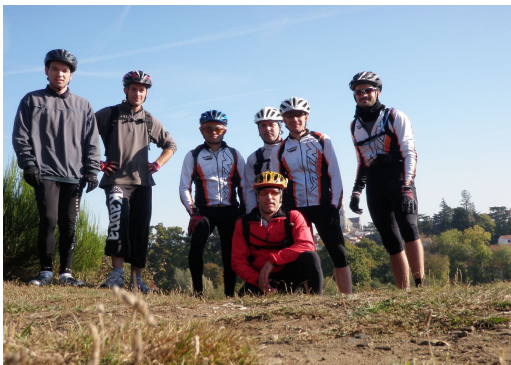
Pause soleil - RC de Vertou - 22/10/11