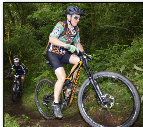
Courage... plus que 99 km.